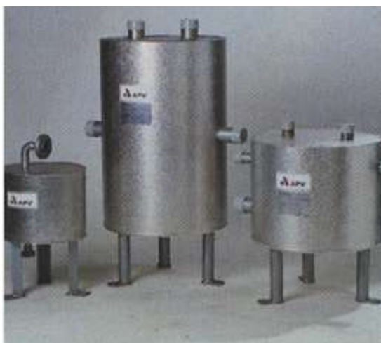
Hình H-2.34 Thiết bị trao đổi nhiệt phối hợp tấm bản và ống chùm

Thiết bị trao đổi nhiệt phối hợp kiểu tấm bản và ống chùm kết hợp được những ưu điểm của cả hai dạng thiết bị trao đổi nhiệt kiểu tấm bản và kiểu ống chùm trong khi vẫn giữ được hình dáng bên ngoài của thiết bị trao đổi nhiệt ở chừng mực nào đó giống như thiết bị trao đổi nhiệt kiểu ống chùm. Thiết bị trao đổi nhiệt dạng này bao gồm một vỏ hình trụ bên trong lắp các tấm trao đổi nhiệt được hàn kín với nhau từng đôi một. Hình dạng của thiết bị trao đổi nhiệt phối hợp kiểu tấm bản và ống chùm được minh họa trong hình H-2.34.