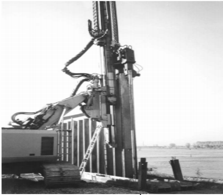
Hình 2.3: Máy đang hạ cừ vào nền.